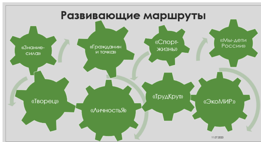
Рисунок 2 – Модель воспитывающей среды в ЦО «Развитие»

Модель воспитывающей среды в Центре образования формируется путем единения направлений воспитательной деятельности ФГОС, ключевых направлений проекта «Школа Минпросвещения», целевых ориентиров результатов воспитания и основных векторов развития личности обучающихся Центра образования. Реализация направлений происходит в каждом из модулей рабочей программы воспитания через прохождение обучающимися индивидуальных развивающих маршрутов. Маршруты имеют названия в соответствии с направлениями воспитательной деятельности (гражданский «Гражданин и точка», патриотический «Мы-дети России», духовно-нравственный «ЛичностьЯ», эстетический «Творец», физкультурно-оздоровительный «Спорт-жизнь», Трудовой «ТрудКрут», экологический «ЭкоМИР», научный «Знание-сила») (рис.2, 3.)