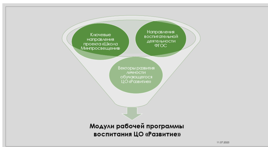
Рисунок 3 – Развивающие маршруты

Каждый из модулей обладает воспитательным потенциалом с особыми условиями, средствами, возможностями воспитания. В каждом модуле отражается содержание воспитательной деятельности в зависимости от развивающего маршрута.